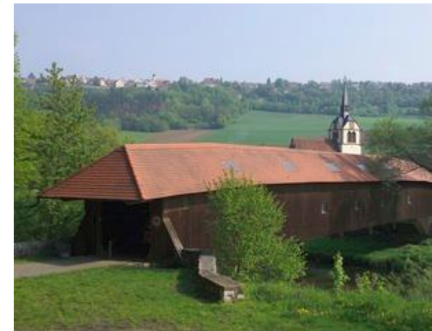
Überdachte Brücke in Bächlingen